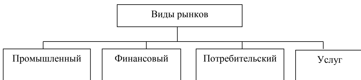
Рисунок 1.2 – Классификация рынков

4.3. Таблицы применяют для лучшей наглядности и удобства сравнения показателей. Название таблицы должно отражать ее содержание, быть точным, кратким. Название таблицы следует помещать над таблицей слева, без абзачного отступа в одну строку с ее номером через тире (см. пример 2). Не допускается размещать название таблицы на одной странице, а таблицу – на другой.