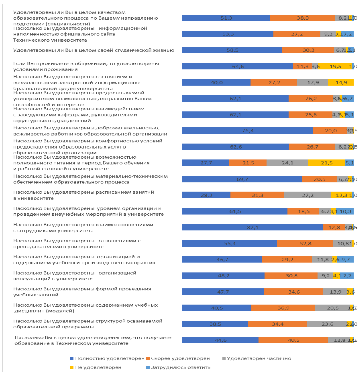
Рисунок 2 – Ответы обучающихся об удовлетворенности образовательной деятельностью, %

Анкета содержала вопросы по критериям оценки качества условий осуществления образовательной деятельности: открытость и доступность информации об образовательной организации; комфортность условий, в которой осуществляется образовательная деятельность; доброжелательность и вежливость работников вуза, а также вопросы по удовлетворенности отдельных дисциплин (модулей) и практик.