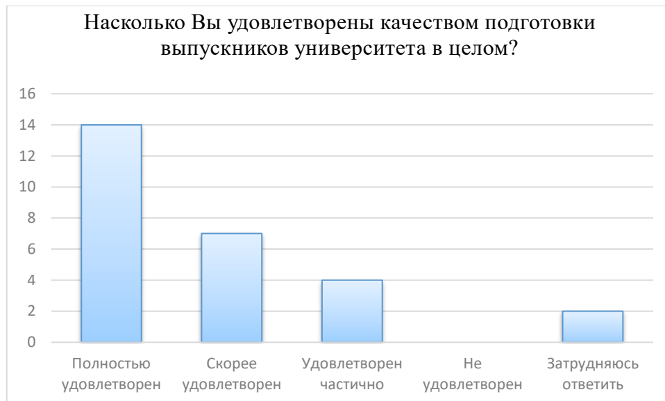
Рисунок 1 – Структура ответов респондентов об удовлетворенности качеством подготовки выпускников университета по направлению подготовки 15.03.02 Технологические машины и оборудование, %

Полученные данные показали удовлетворенность работодателей качеством подготовки выпускников университета, что свидетельствует о достаточно стабильной системе эффективного взаимодействия работодателей-выпускников-университета.